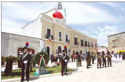
La manifestazione svolta il 24 maggio a S. Vito dei Normanni

E' tempo di bilanci per l'Unione Nazionale Ufficiali in Congedo d'Italia (UNUCI), che nel corso dell'anno si è distinta per l'attiva e qualificata presenza sul territorio promuovendo e organizzando alcune iniziative di particolare rilievo e significato. E merita senza dubbio di essere ricordata la manifestazione svolta il 24 maggio a San Vito dei Normanni con la settima festa del Tricolore.