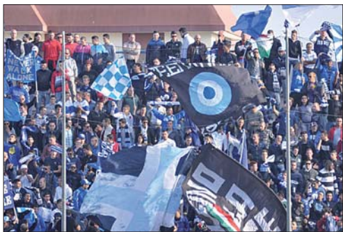
Tifosi biancoazzurri nella curva dello stadio «Franco Fanuzzi»